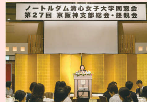
支部総会での理事長のごあいさつ