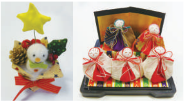
クリスマスカップ 愛らしいお雛様

毎月第二火曜日と第四土曜日、ルルド館の第一会議室は、カワイイ小物たちで華やきます。せっせと針を動かしているのは、期も学科も違う同窓生、十数名。都合のつく日に参加して、おしゃべりを楽しみながら製作しています。生活に役立つ日用品から、おしゃれな小物、クリスマスグッズなど、毎年みんなでアイデアを出し合って、新しい作品にチャレンジしています。