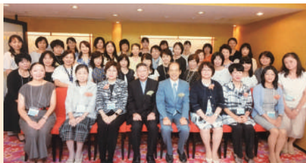
同窓生の輪が広がります