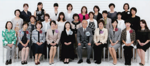
同窓のご縁にありがとう