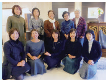
来年も元気で会いましょう