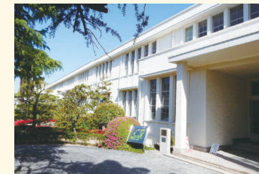
正面玄関と今も使われている教室

敷地の南側の道路に面して端正な姿を現している本館は、2階建ての低層建物で凛とした美しさを醸し出しています。建物は、垂直性を意識した窓周りの連続する小柱のデザインと、水平に取り付けられた窓庇 まどびさし によって伸びやかな姿を表現しています。近代建築では庇はあまり取り付けられませんが、設計者のアントニン・レーモンド(1888-1976)は、日本の伝統的な民家に魅了され日本建築の良さを採り入れ設計しています。