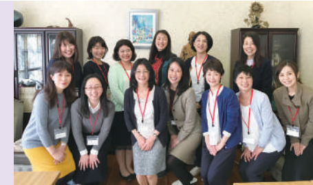
吉祥寺のナミュールノートルダム修道院にて