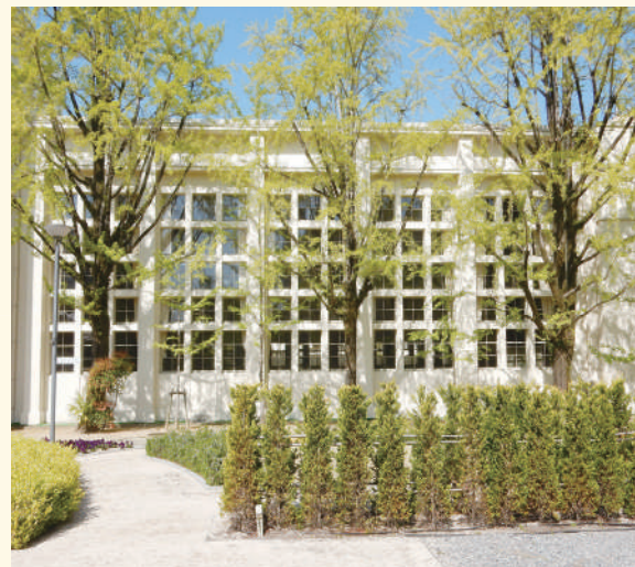
大講義室の窓ガラスと銀杏並木

美しい秋の銀杏並木を思い出される方も多いことと思います。この建物は、かつては講堂でしたが、現在は大講義室として使われています。また普段は学生たちがくつろげる大空間としても利用されています。窓枠は正方形を基調にして、端正な構造美を表現しています。全てのガラス窓は、かつて鎖を引っ張ることによって開閉ができていました。