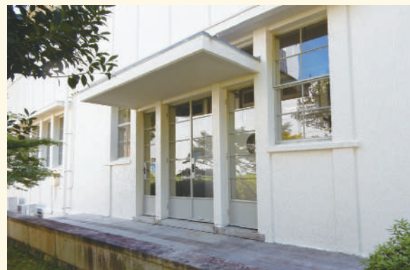
中庭に面した出入口

当時の設計でも、本館の中庭は花園として計画されていました。今でも季節が良くなるとお弁当を広げておしゃべりしている学生さんの姿をよく見受けられます。この中庭に面した出入口のデザインは、最高です。閉ざさない出入口で、庇 ひさし のデザインも簡素ではありますが均整の取れた美しい入り口を表現しています。