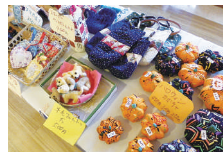
フリージアの会の手作り品