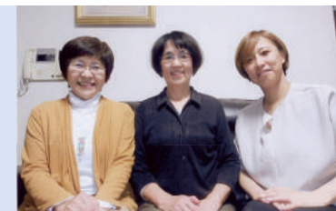
「あゆみ」打ち合わせの日に