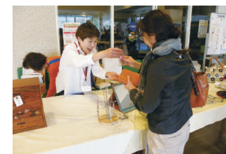
セレクトコーナー