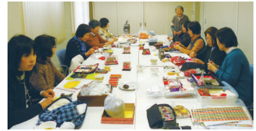
こんなものを作ったらどうかしら？

フリージアの会は、奨学金のためだけでなく、同窓生の交流の場にもなっています。誰かのために何かしたいと思われているあなたと一緒に活動しませんか？同窓生なら、いつでもどなたでも参加できます。またこんなものが欲しいという要望もお寄せください。お待ちしております。