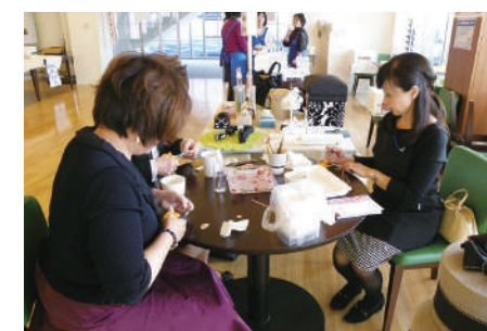
ポーセラーツ体験中