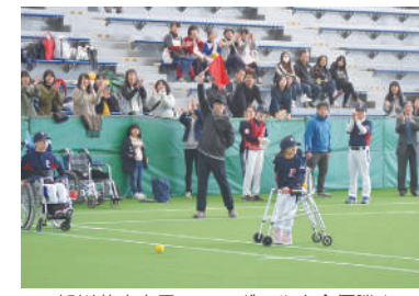
旭川荘療育園テニール大会優勝!

同窓生の皆様!旭川荘で笑顔の輪を広げましょう。一人ひとりの小さな愛から大きな喜びを一緒に創りましょう。仲間をお待ちしています!