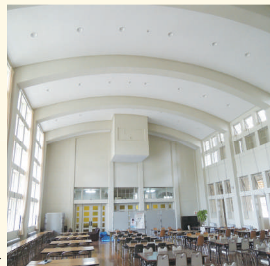
優しい円弧の天井と上部の映写室(100ND)▶

美しい秋の銀杏並木を思い出される方も多いことと思います。この建物は、かつては講堂でしたが、現在は大講義室として使われています。また普段は学生たちがくつろげる大空間としても利用されています。窓枠は正方形を基調にして、端正な構造美を表現しています。全てのガラス窓は、かつて鎖を引っ張ることによって開閉ができていました。