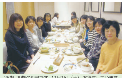
38期・39期の役員です。11月16日(土)、お待ちしております。