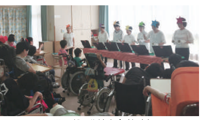
ハンドベル演奏会(七夕)

私は小学生の時、初めて旭川荘でおしめたたみのボランティア経験をしました。その時に感じた混沌とした気持ちを持ったまま生きてきました。今回、決心してエンジェル会の活動に参加しました。活動初日、ドアの向こうで多くの子供たちが覗き込むように見えて。私たちの顔を見つけて、「○○さんー遊ぼうー」の声と笑顔にびっくりしました。えっ、私たちの事を待っていてくれるのだ。普段の私のあたりまえの生活とは一体何か。子供達は置かれた状況のなかで一生懸命生きてる。その中で私にできる事は何だろうか。ハンドベルの練習にも初めて参加しました。クリスマスに行なったハンドベルの演奏会では笑顔が溢れ、一緒に演奏できる喜びは最高の感動です。感謝です。